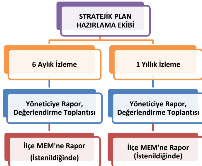
Şekil 2 İzleme ve Değerlendirme Süreci

Müdürlüğümüzün 2019-2023 Stratejik Planı İzleme ve Değerlendirme sürecini ifade eden İzleme ve Değerlendirme Modeli hazırlanmıştır. Okulumuzun Stratejik Plan İzleme-Değerlendirme çalışmaları eğitim-öğretim yılı çalışma takvimi de dikkate alınarak 6 aylık ve 1 yıllık sürelerde gerçekleştirilecektir. 6 aylık sürelerde Okul Müdürüne rapor hazırlanacak ve değerlendirme toplantısı düzenlenecektir. İzleme-değerlendirme raporu, istenildiğinde İlçe Milli Eğitim Müdürlüğüne gönderilecektir.